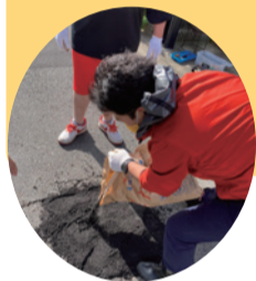
小さな欠損は補修材で