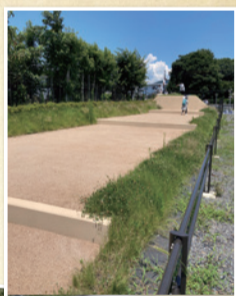
一号線のトヨタカローラさんの裏手に位置します